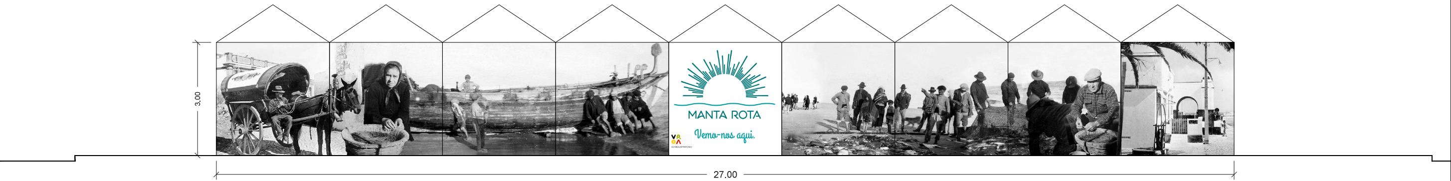
Alçado Norte - Imagem Proposta (sujeita a alteração);